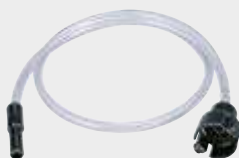
191X21-8 Mlaznica za uske prostore