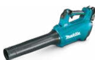
DUB184 18 V - LXT aku. duvaljka 194 km/h, 10,9 N