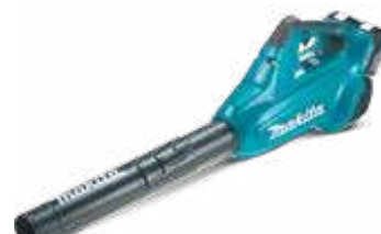
DUB362 18 + 18 V - LXT aku. duvaljka 194 km/h, 10,9 N