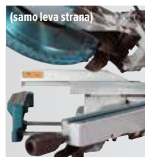
(samo leva strana)