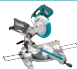
LS1018N Potezno nagibna testera