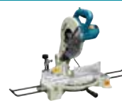
LS1040N Potezna testera